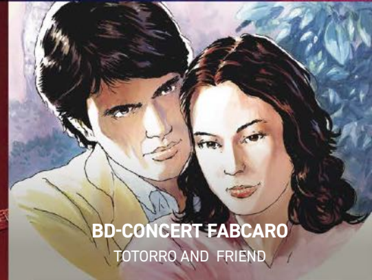
BD-CONCERT FABCARO TOTORRO AND FRIEND