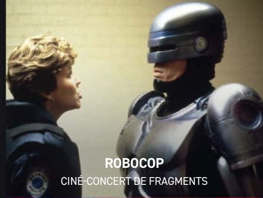
ROBOCOP CINÉ-CONCERT DE FRAGMENTS