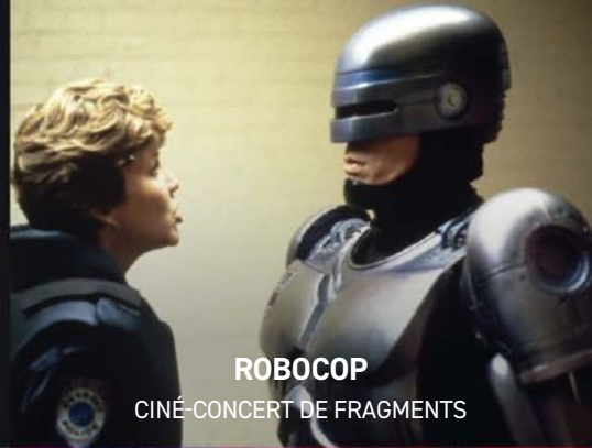
ROBOCOP CINÉ-CONCERT DE FRAGMENTS