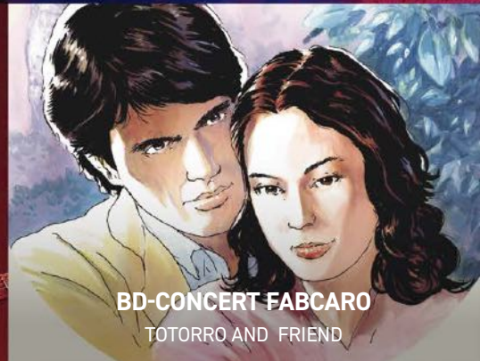
BD-CONCERT FABCARO TOTORRO AND FRIEND