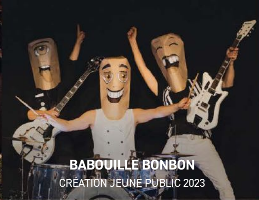
BABOUILLE BONBON CRÉATION JEUNE PUBLIC 2023