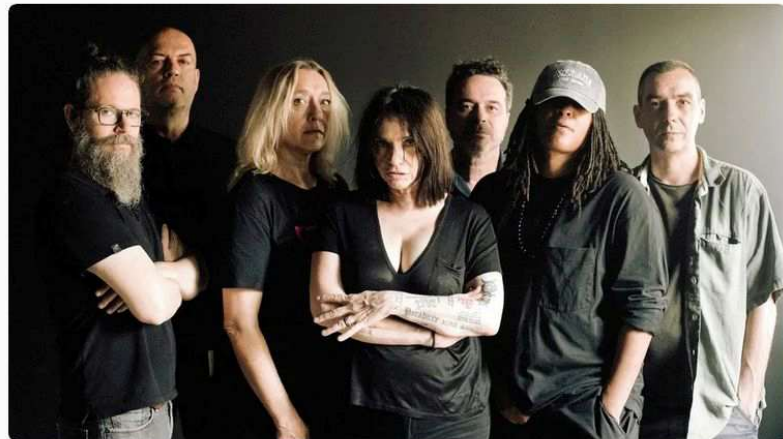
Troubles - @LynnK

Publié le lundi 29 avril 2024 à 14h14 | 1 min | PARTAGER