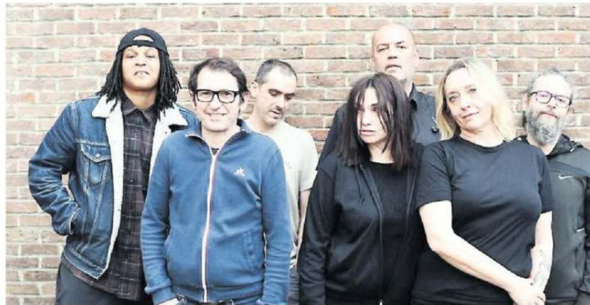
Béatrice Dalle, entourée de Virginie Despentès et des membres du groupe lyonnais Zéro, seront ce mercredi soir au Bikini.

Après « Paso », on voulait créer une surprise, en ne dévoilant pas trop les auteurs dont on allait lire les textes. Je peux te dire qu'on a choisi des poésies qui parlent des exclus de la société. Exclutés par leur religion, leur appartenance sociale, leurs choix politiques, sexuels... Ce sont des textes très forts que l'on propose ainsi, comme si on montrait des cartes : si la carte te plaît, tu la prends et tu te prends ces textes en plein dans la gueule ! Je ne suis pas une autorité, une acharnée qui défonce des portes ouvertes, mais ce serait tellement bien de se retrouver autour de la poésie, et d'arrêter de se foutre sur la gueule ! Pourquoi