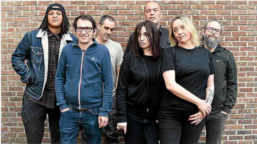
La rappeuse Casey, la comédienne Béatrice Dalle et la romancière Virginie Despentes avec les musiciens du groupe Zéro.