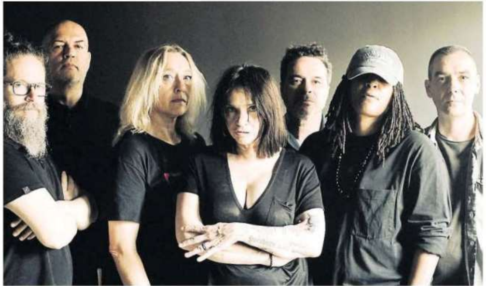
Un concert lecture rock avec « Troubles »