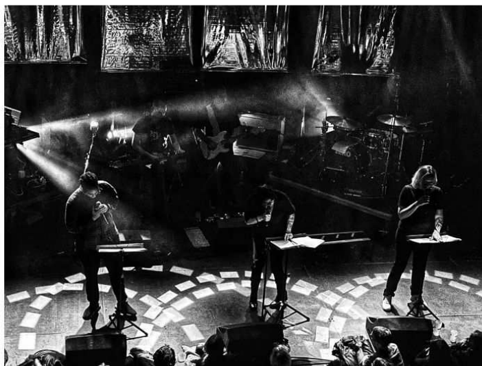
Trouble