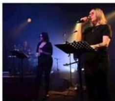
Virginie Despentes au premier plan et Béatrice Dalle.