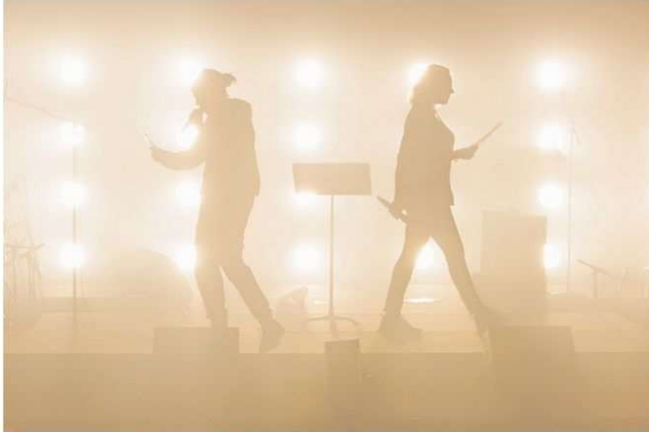
Le récital féministe Viril rassemblait déjà Virginie Despentes, Béatrice Dalle, Casey et Zéro.

Un nouveau concert littéraire endiablé avec Virginie Despentes, Béatrice Dalle, Casey et le groupe Zéro arrive début décembre au Transbordeur à Villeurbanne.