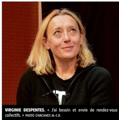
VIRGINIE DESPENTES. « J'ai besoin et envie de rendez-vous collectifs. »

■ Vous avez toujours fait des lectures ? Depuis trente ans. Les lectures musi-