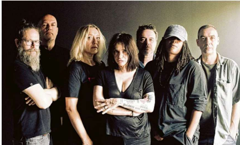
La romancière Virginie Despentes, l'actrice Béatrice Dalle et la rappeuse Casey, accompagnées du groupe de rock noise Zéro, seront au 6Mic ce jeudi soir.